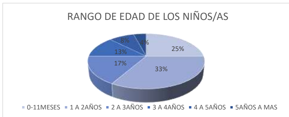
Figura 3: Rango de edad de los niños/as con sentencia de privación de la patria potestad con declaratoria de adoptabilidad

Considerando que: La patria potestad no solamente es el: “conjunto de derechos sino también de obligaciones de los padres relativos a sus hijos e hijas no emancipados, referentes al cuidado, educación, desarrollo integral, defensa de derechos y garantías de los hijos de conformidad con la Constitución y la ley” (Código de la Niñez y Adolescencia, 2003).