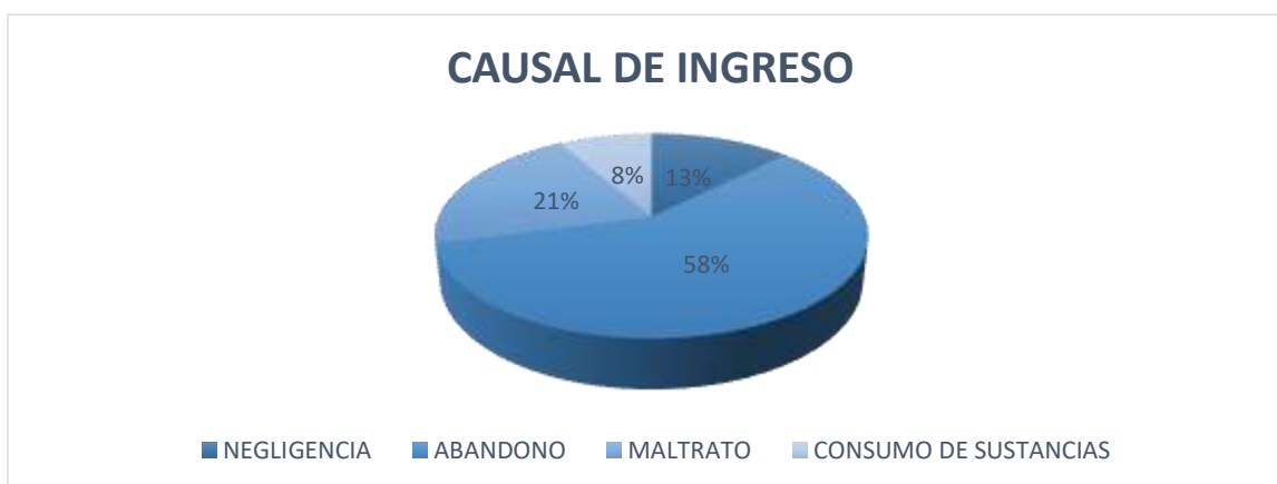
Figura 1: Causal de ingreso