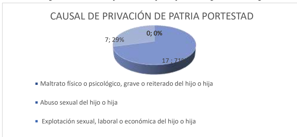
Figura 2: Causal de la pérdida de la patria potestad-argumentación legal