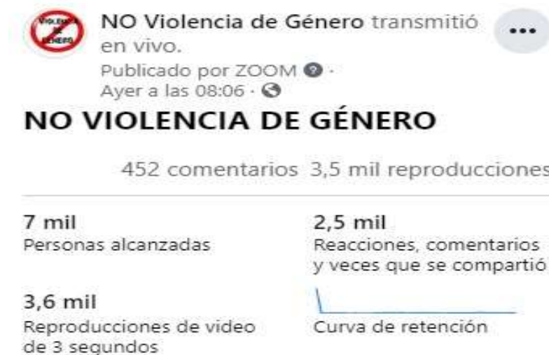
Figura 1: Resultado de la transmisión en vivo

El proceso de socialización del Foro de la Mujer “ni una menos” obtuvo resultados positivos con más de 250 visualizaciones, 88 veces compartido, 462 comentarios, 2500 reacciones en vivo 3.440 reproducciones en la página oficial de Facebook denominada “No Violencia de Género” con nuestro lema “Ni Una Menos”. Finalmente tuvo un alcance de 7000 personas.