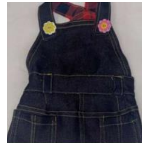
Overol de perrito

Su vida social y económica cambió para bien, pues ya no tendrá que dañarse las manos lavando y planchando ropa ajena, ahora disfruta lo que hace.