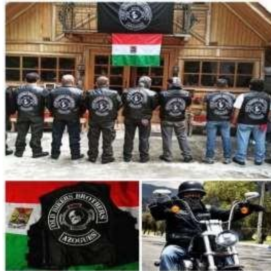
Figura 1. Casa Club Old Bikers Brothers Azogues