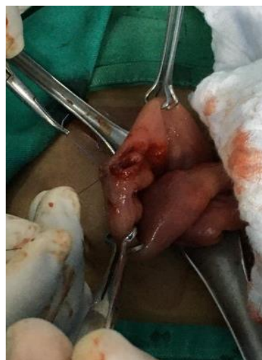
Figura 5: Enterotomía.

presenta evolución postquirúrgica favorable, canalizando flatos, con eliminación de áscaris lumbricoides por boca y nariz post administración de antiparasitarios. Se encuentra hemodinámicamente estable, herida quirúrgica sin signos de inflamación, por lo que se decide el alta médica y se envía con Albendazol 400 miligramos vía oral dosis única.