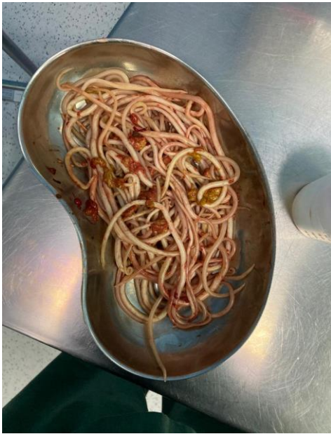
Figura 2: Ejemplares extraídos

Paciente en tratamiento post quirúrgico con analgesia, antibióticoterapia a base de Ampicilina más sulbactám 900 miligramos cada 6 horas por 7 días y con Piperacina 1,5 gramos dosis diaria por sonda nasogástrica por 3 días, Ácido ascórbico 500 miligramos intravenoso diario, paciente con favorable evolución postquirúrgica, canalizando flatos, deposiciones con evidencias de áscaris lumbricoides; hemodinámicamente estable por lo que se decide el alta médica.