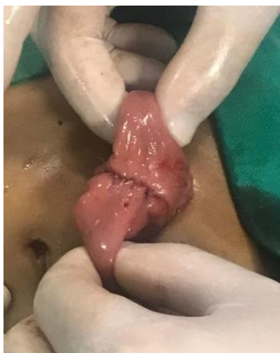
Figura 6: Anastomosis primaria.