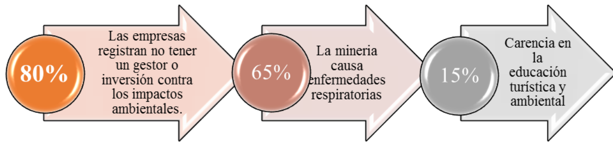
Figura 3: Datos estadísticos del contexto micro sobre el “Estudio de la sobreexplotación en los destinos turísticos de la Parroquia de San Antonio de Pichincha y la recreación como alternativa para esta problemática”

Contextualizado, el problema se plantea la pregunta interrogativa que debe ser contestada al final de la presente investigación ¿Cuál es el aporte que nos ofrece la recreación como alternativa para evitar la sobreexplotación de los destinos turísticos en la Parroquia de San Antonio de Pichincha? Producto de la pregunta investigativa se formula el objetivo de investigación. Describir la importancia de la recreación como alternativa viable para disminuir la sobreexplotación turística en la parroquia de San Antonio de Pichincha.