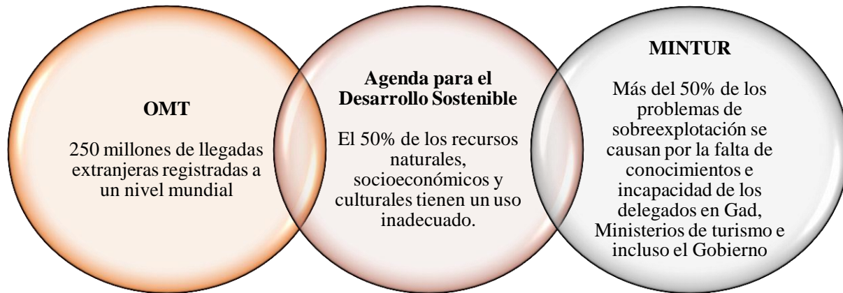
Figura 1: Datos estadísticos del contexto macro sobre el “Estudio de la sobreexplotación en los destinos turísticos de la Parroquia de San Antonio de Pichincha y la recreación como alternativa para esta problemática”.

cierto peligro para los turistas como atentados, robos, asesinatos u otros actos de otra naturaleza; en el Ecuador, gracias a este problema social, ha causado un déficit en la tasa de visitantes que llegan al país, han surgido problemas de inseguridad. Los delitos comunes, como el robo y el hurto, son una realidad en algunas zonas y afectan negativamente la experiencia turística.