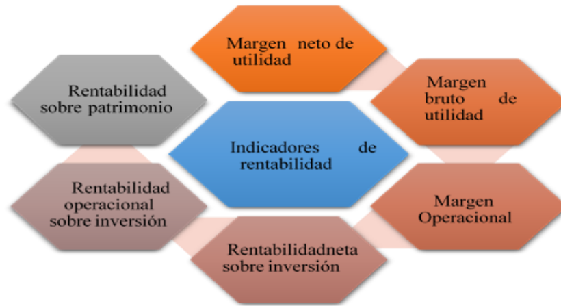
Figura 3: Indicadores de rentabilidad

Nota. La figura muestra los indicadores de rentabilidad necesarios para realizar en la empresa.