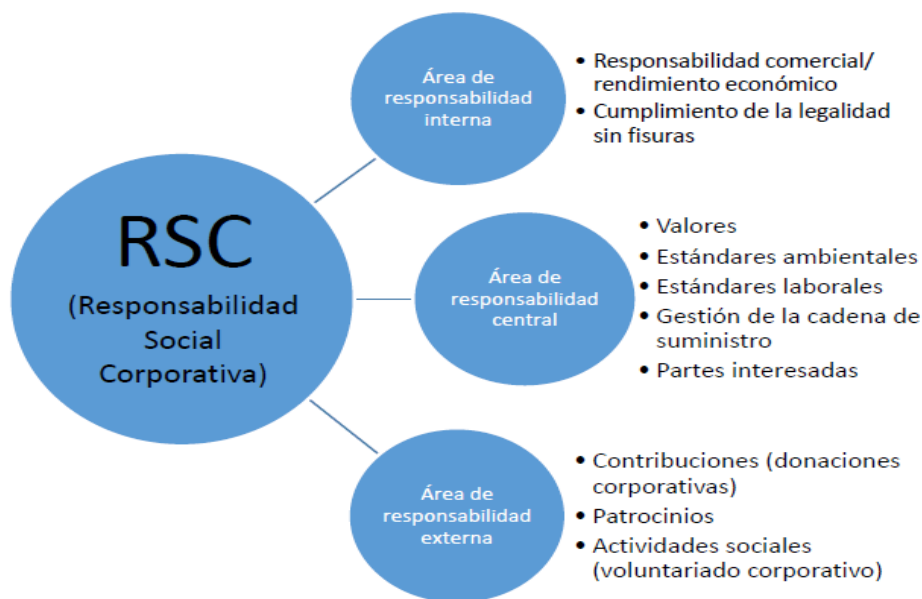
Gráfico #1 Responsabilidad Social Corporativa

La relevancia de este factor se basa en retribuir y beneficiar a la sociedad que está directamente relacionada con el giro del negocio de la organización, con el objetivo de devolverle a la sociedad parte de lo que le han brindado a la empresa permitiéndole surgir y desarrollarse con una cuota de mercado establecida, lo que ha significado gran parte de su progreso. (Neró, 2016)