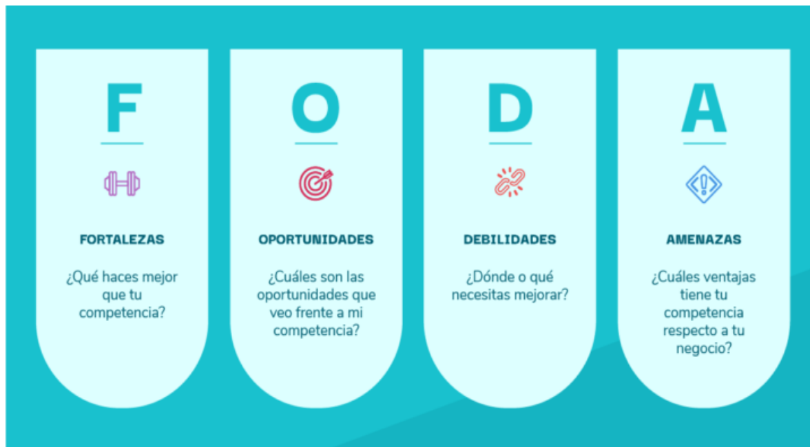
Gráfico # 5 Análisis FODA