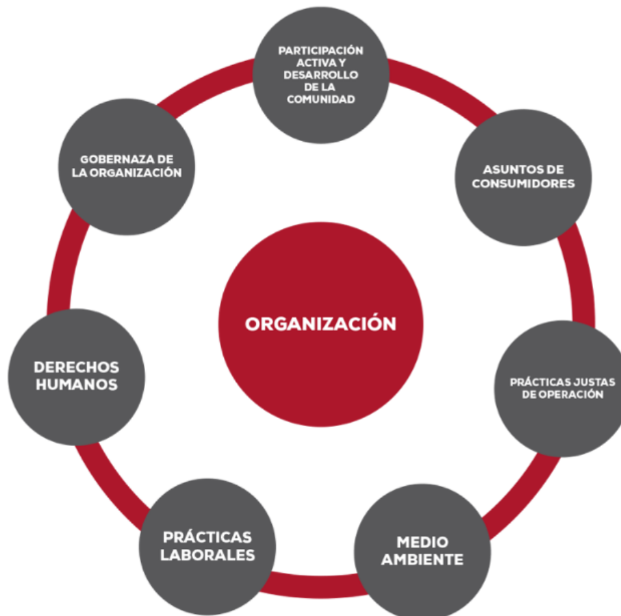
Gráfico # 4 importancia de la RSC

Cuando existe responsabilidad social corporativa por parte de una organización se beneficia a la sociedad de diferentes partes como: