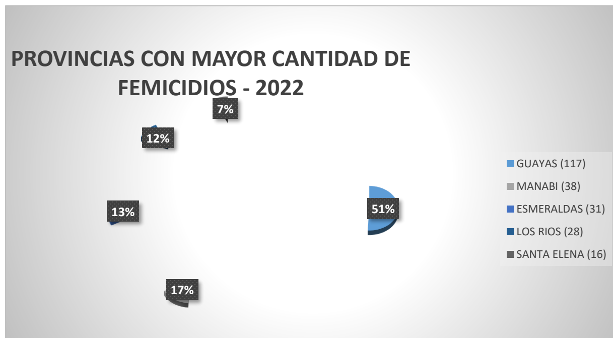
Figura.2 Provincias con mayor cantidad de muertes violentas hacia mujeres en 2022.