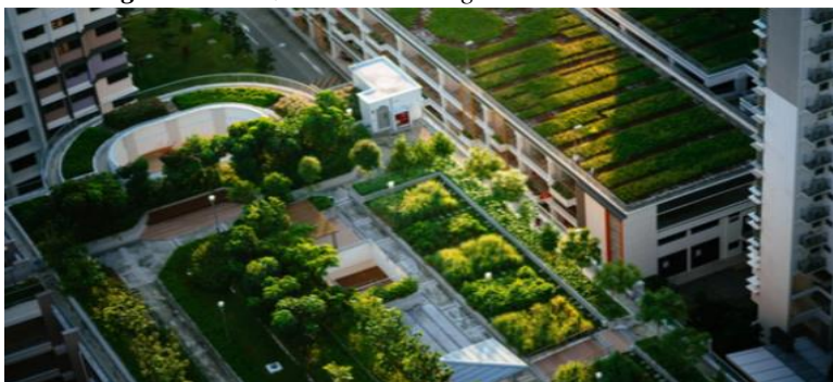
Figura 1. La azotea verde más grande de Latinoamérica

Los esfuerzos para alcanzar el confort climático en las edificaciones han derivado en estrategias pasivas que logran el propósito de sistemas de refrigeración y calefacción sustentables, la adopción de estas prácticas en las diversas naciones y comunidades es fundamental para la protección medioambiental, sin detrimento de las comodidades modernas que las personas disfrutan hoy en día en los edificios que habitan.