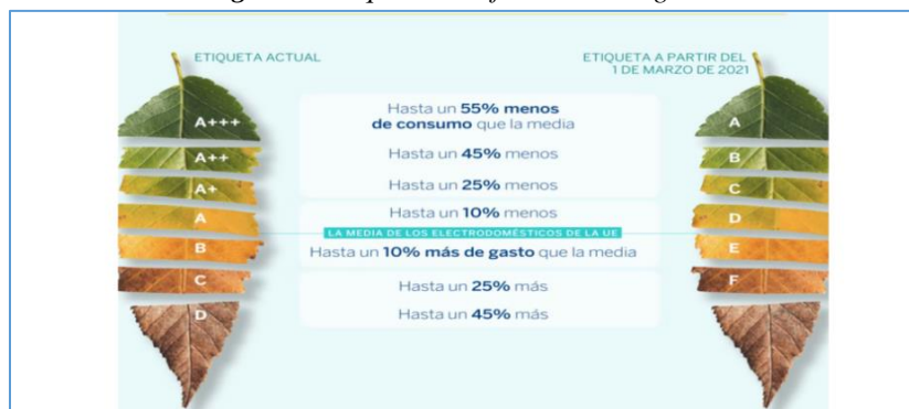
Figura 2. Etiquetas de eficiencia energética

Según el organismo (Ministerio de Energías, 2019), casi todos los países en Sudamérica tienen programa de certificación energética (etiquetado) de tipo comparativo y de cumplimiento obligatorio, las cuales podrían contribuir con ahorros de energía sumamente importantes. Se estima que la transición a refrigeradores, aires acondicionados y ventiladores eficientes en América Latina y el Caribe ahorraría anualmente 138 TWh, casi 20,000 millones de dólares estadounidenses y evitaría la liberación de aproximadamente 44 millones de toneladas de CO 2 (OLADE, 2014).