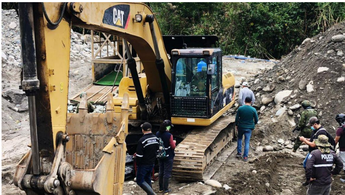
Imagen 2: Minería ilegal en Napo y Orellana, en Amazonía del Ecuador. Destrucción de maquinaria.

En cambio, habiendo realizado la investigación con la recogida de datos, con un corte hasta el año 2021, podemos indicar que las labores de minería artesanal y de mineros informales en el Ecuador, han crecido en un porcentaje muy alto en comparación al año 2010, por múltiples factores, como el económico, social y laboral; pero en cambio, como no se ha realizado ningún censo poblacional minero no podemos obtener cifras reales por cantón, por provincia o región, únicamente existen datos de prensa del auge de los delitos contra los recursos mineros, educación sobre recursos naturales, eficiencia pública y política pública, para ir combatiendo y erradicando la actividad minera ilegal.