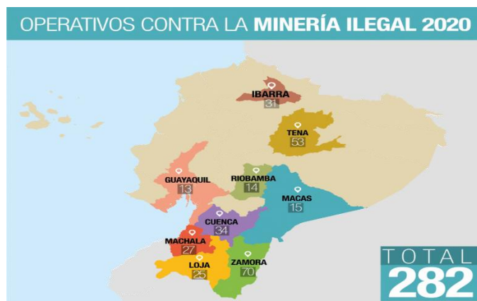
Figura 1: Mapa de provincias donde se ejecuta la actividad minera ilegal.