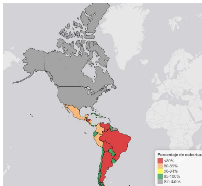
Figura 3: Cobertura de vacunación en el año 2023 en América Latina

Por otro lado, países como Chile, Uruguay y Costa Rica destacan por contar con herramientas adicionales, como boletines anuales de cobertura, manuales para poblaciones especiales y guías específicas para la vacunación contra la influenza, además de plataformas en línea actualizadas que facilitan el acceso a la información. En contraste, Bolivia, El Salvador, Honduras y Guatemala presentan brechas significativas, como la falta de manuales específicos o lineamientos completos para grupos vulnerables. Estas carencias podrían limitar la efectividad de sus programas de vacunación, especialmente en poblaciones rurales o marginadas. En conjunto, la tabla resalta las disparidades regionales, subrayando la necesidad de que los países con sistemas más desarrollados sirvan de referencia para aquellos con mayores limitaciones, promoviendo así un enfoque regional más equitativo y robusto para la inmunización.